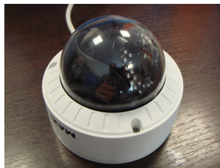
dopuszczalne pochylenie – wszystkie diody są ponad obudowę

W celu ustawienia wymaganego pola widzenia kamery przydatna jest ukośna plastikowa podstawa montażowa IJ-D101. Ta podstawa pasuje także do uchwytu IW-D100. W zależności od sytuacji można także zastosować