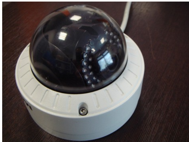
zbyt duże pochylenie – część diod świeci w obudowę