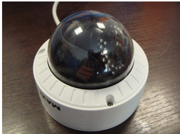
dopuszczalne pochylenie – wszystkie diody są ponad obudowę

W celu ustawienia wymaganego pola widzenia kamery przydatna jest ukośna plastikowa podstawa montażowa IJ-D101. Ta podstawa pasuje także do uchwyty IW-D100. W zależności od sytuacji można także zastosować uchwyt ścienny metalowy IW-D100, plastikowy IW-D101 oraz podstawy montażowe metalowa IJ-D100.