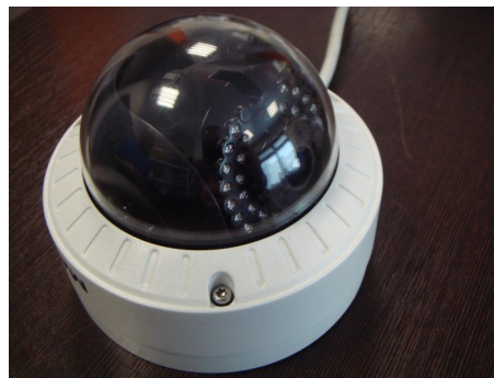
zbyt duże pochylenie – część diod świeci w obudowę